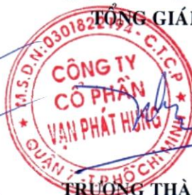
TRƯỞNG THÀNH NHÂN